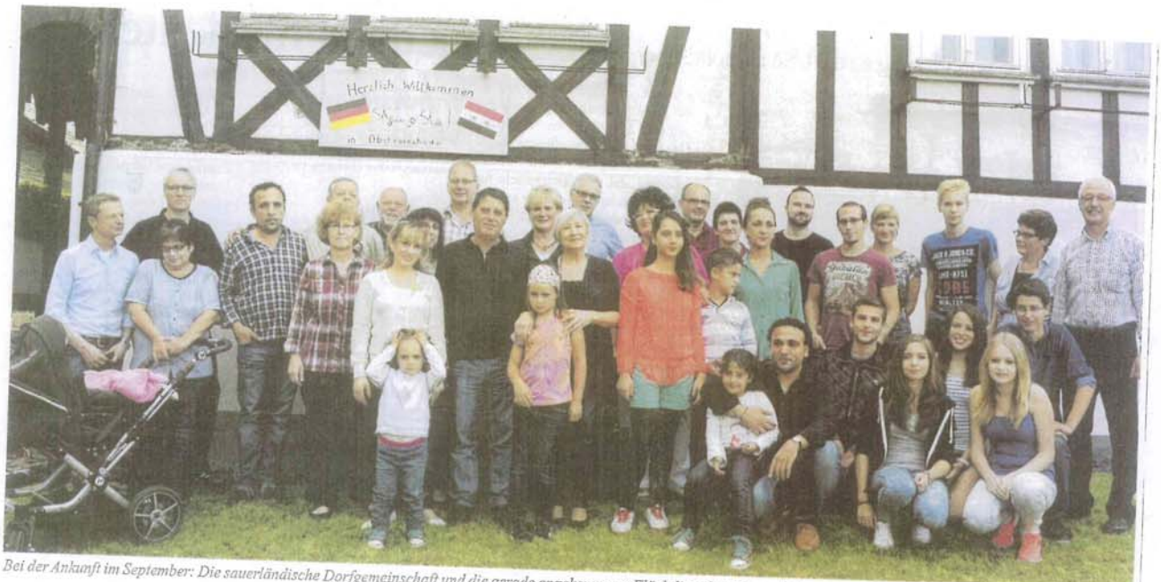
Bei der Ankunft im September: Die sauerländische Dorfgemeinschaft und die gerade angekommene Flüchtlingsfamilie aus Syrien