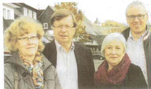
Das Führungsquartett der Dorfgemeinschaft Oberveischede